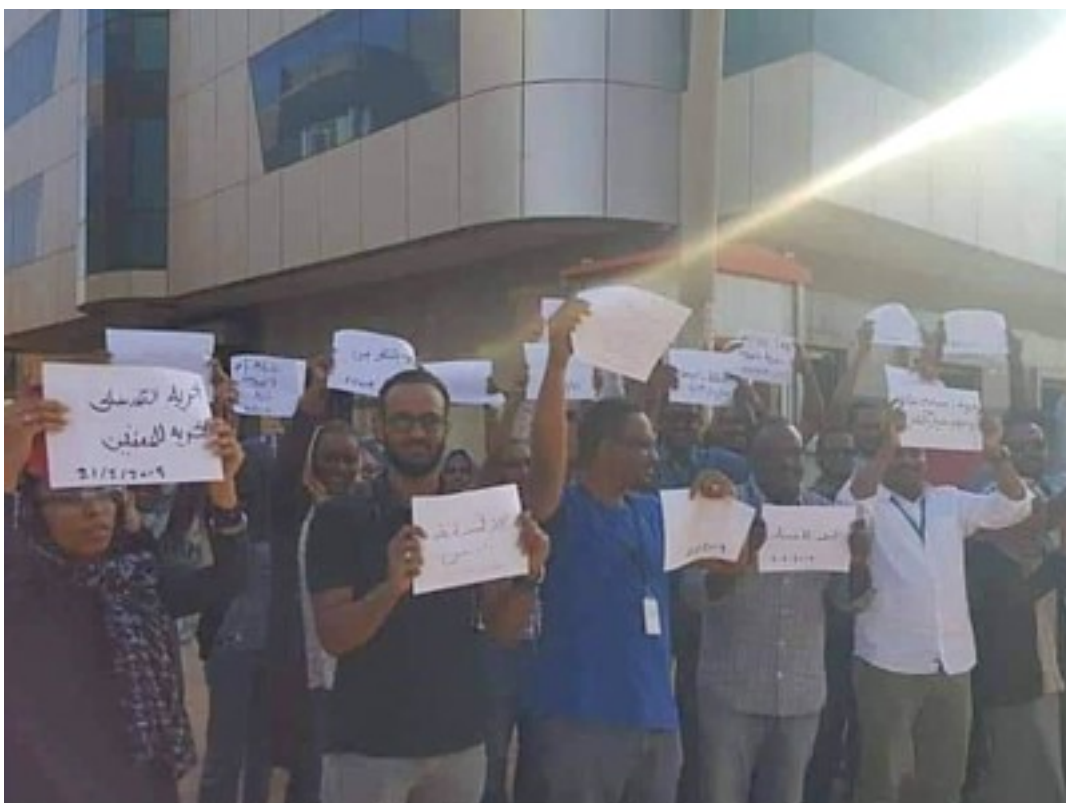
Beschäftigte von Ericsson