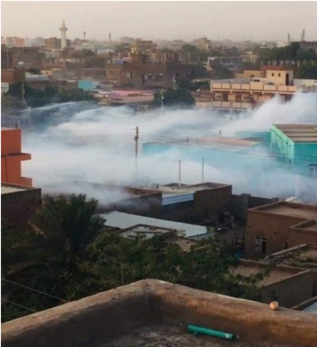
Tränengas über Khartoum

13.03.2019: Karthoum, Sudan | Ein sudanesisches Sondergericht hat am Samstag (9.3.) neun junge Frauen zu einem Monat Gefängnis und 20 Peitschenhieben verurteilt. Grund: Sie hatten sich an der Demonstration "Sudanese Women's Advocacy" zum Internationalen Frauentag am 8. März beteiligt. ++ Seit 22. Februar herrscht der Ausnahmezustand ++ Die Proteste gehen trotzdem weiter ++