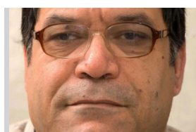
"Die drei großen

Auf Platz zwei folgt mit 47 Mandaten die Liste Fatih, eine Allianz des fest zum Iran stehende Politikern und Führers der gefürchteten PMU-Milizen Hadi al-Amiri. Lediglich auf den dritten Platz kam der von den USA favorisierte amtierende schiitische Regierungschef Haidar al-Abadi mit seiner Liste Nasr (Victory/Sieg) mit 42 Sitzen.